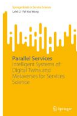
Parallel Services Ladenpreis: 54,99EUR