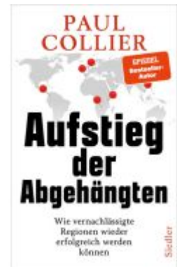
Aufstieg der Abgehängten Ladenpreis: 28,80EUR