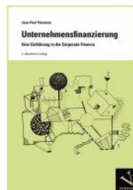
Unternehmensfinanzierung Ladenpreis: 27,90EUR