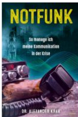
Notfunk - So manage ich meine Kommunikation in der Krise Ladenpreis: 30,90EUR