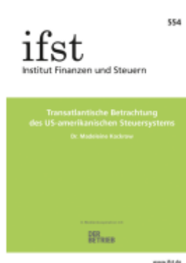
ifst-Schrift 554 Ladenpreis: 15,50EUR