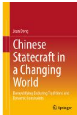
Chinese Statecraft in a Changing World Ladenpreis: 36,29EUR