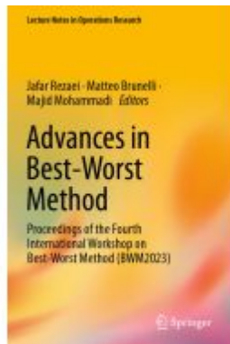
Advances in Best-Worst Method Ladenpreis: 175,99EUR

Wir haben andere Produkte gefunden, die Ihnen gefallen könnten!