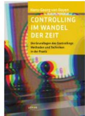
Controlling im Wandel der Zeit Ladenpreis: 20,50EUR