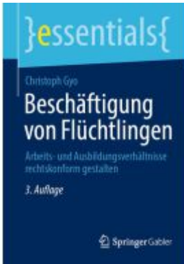
Beschäftigung von Flüchtlingen Ladenpreis: 15,41EUR