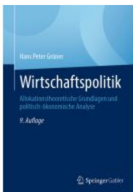
Wirtschaftspolitik Ladenpreis: 33,92EUR