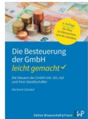
Die Besteuerung der GmbH – leicht gemacht Ladenpreis: 18,40EUR