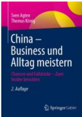
China – Business und Alltag meistern Ladenpreis: 46,26EUR