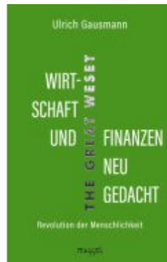
Wirtschaft und Finanzen neu gedacht Ladenpreis: 25,70EUR