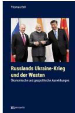
Russlands Ukraine-Krieg und der Westen Ladenpreis: 20,40EUR