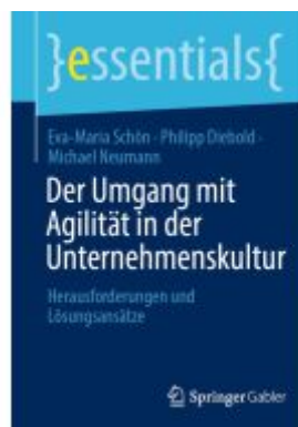
Der Umgang mit Agilität in der Unternehmenskultur Ladenpreis: 15,41EUR