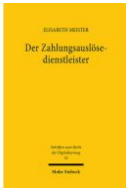
Der Zahlungsauslösedienstleister Ladenpreis: 101,80EUR