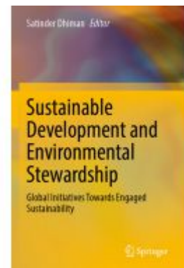
Sustainable Development and Environmental Stewardship Ladenpreis: 164,99EUR