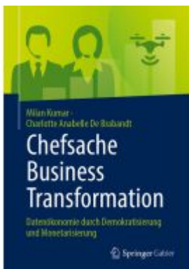
Chefsache Business Transformation Ladenpreis: 41,11EUR