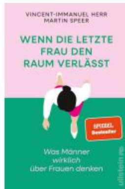
Wenn die letzte Frau den Raum verlässt Ladenpreis: 20,60EUR