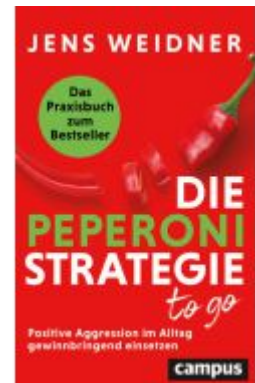
Die Peperoni-Strategie to go Ladenpreis: 25,70EUR