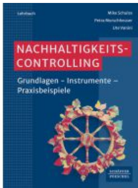
Nachhaltigkeitscontrolling Ladenpreis: 51,40EUR

Wir haben andere Produkte gefunden, die Ihnen gefallen könnten!