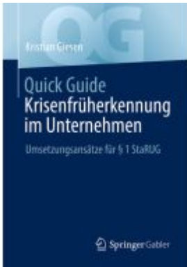
Quick Guide Krisenfrüherkennung im Unternehmen Ladenpreis: 30,83EUR