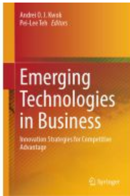
Emerging Technologies in Business Ladenpreis: 219,99EUR