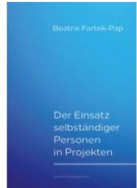
Der Einsatz selbständiger Personen in Projekten Ladenpreis: 25,70EUR