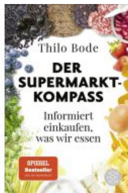
Der Supermarkt-Kompass Ladenpreis: 15,50EUR