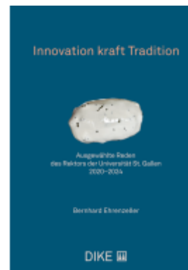
Innovation kraft Tradition Ladenpreis: 72,00EUR