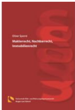
Maklerrecht, Nachbarrecht, Immobilienrecht Ladenpreis: 25,70EUR