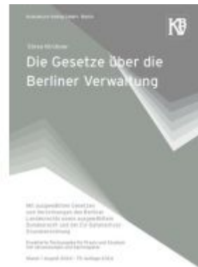
Die Gesetze über die Berliner Verwaltung Ladenpreis: 30,90EUR