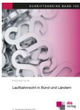
Laufbahnrecht in Bund und Ländern Ladenpreis: 60,60EUR