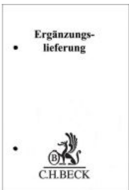
Gesetze des Landes Berlin 76. Ergänzungslieferung Ladenpreis: 71,00EUR