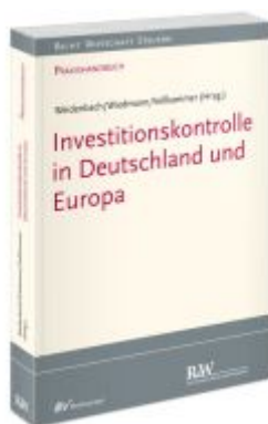
Investitionskontrolle in Deutschland und Europa Ladenpreis: 173,80EUR