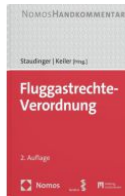
Fluggastrechte-Verordnung Ladenpreis: 79,00EUR