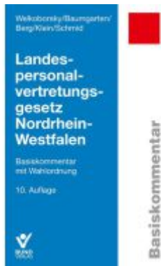
Landespersonalvertretungsgesetz Nordrhein-Westfalen Ladenpreis: 56,50EUR