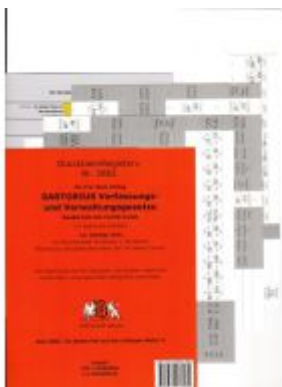
DürckheimRegister@ SARTORIUS, Gesetze und §§, OHNE Stichworte Ladenpreis: 18,50EUR