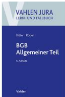
BGB Allgemeiner Teil Ladenpreis: 29,80EUR

Wir haben andere Produkte gefunden, die Ihnen gefallen könnten!