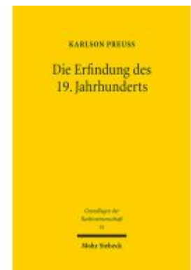
Die Erfindung des 19. Jahrhunderts Ladenpreis: 91,50EUR

Alle Preise inkl. MwSt. zzgl. Versand. Bei Bestellung im LexisNexis Onlineshop kostenloser Versand innerhalb Österreichs.