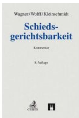
Schiedsgerichtsbarkeit Ladenpreis: 115,20EUR