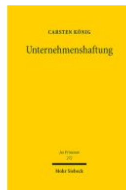
Unternehmenshaftung Ladenpreis: 153,20EUR