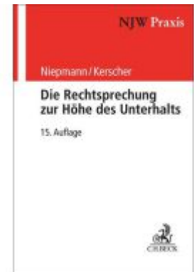
Die Rechtsprechung zur Höhe des Unterhalts Ladenpreis: 66,90EUR