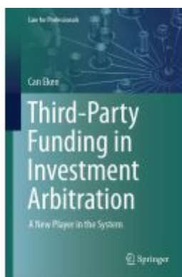
Third-Party Funding in Investment Arbitration Ladenpreis: 131,99EUR