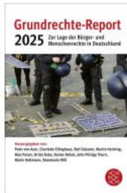
Grundrechte-Report 2025 Ladenpreis: 14,40EUR