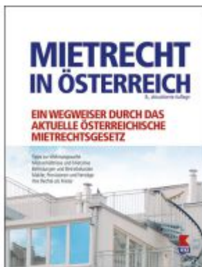
Mietrecht in Österreich Ladenpreis: 25,00EUR