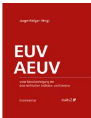
Kommentar zu EUV und AEUV Ladenpreis: 398,00EUR