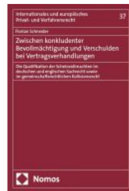
Zwischen konkludenter Bevollmächtigung und Verschulden bei Vertragsverhandlungen