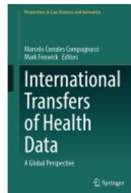
International Transfers of Health Data Ladenpreis: 186,99EUR