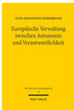
Europäische Verwaltung zwischen Autonomie und Verantwortlichkeit Ladenpreis: 112,10EUR