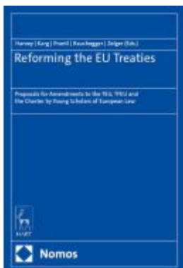
Reforming the EU Treaties Ladenpreis: 71,00EUR

Wir haben andere Produkte gefunden, die Ihnen gefallen könnten!