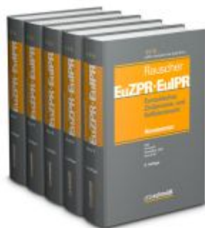
Europäisches Zivilprozess- und Kollisionsrecht EuZPR/EuIPR, Bände I-V, Pflichtfortsetzung Ladenpreis: 1.521,50EUR