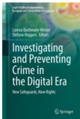
Investigating and Preventing Crime in the Digital Era