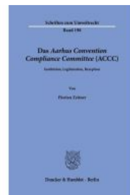
Das Aarhus Convention Compliance Committee (ACCC). Ladenpreis: 92,50EUR