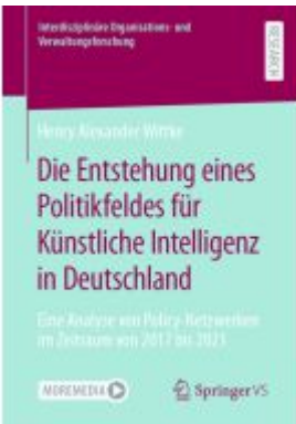
Die Entstehung eines Politikfeldes für Künstliche Intelligenz in Deutschland Ladenpreis: 77,09EUR