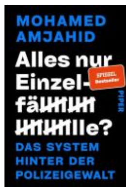
Alles nur Einzelfälle?