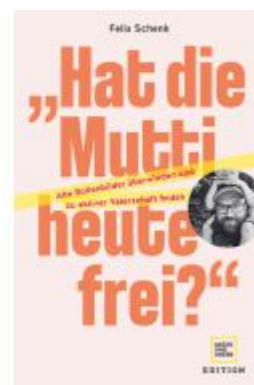
„Hat die Mutti heute frei?“