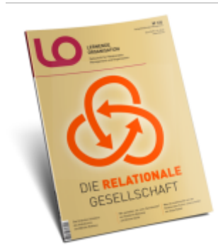
Die Relationale Gesellschaft Ladenpreis: 28,99EUR