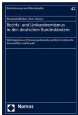
Rechts- und Linksextremismus in den deutschen Bundesländern