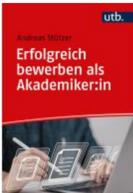
Erfolgreich bewerben als Akademiker:in Ladenpreis: 20,50EUR