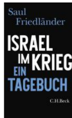
Israel im Krieg Ladenpreis: 24,70EUR