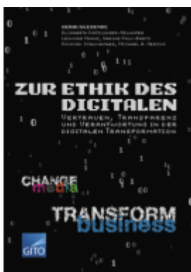
Zur Ethik des Digitalen