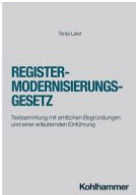
Registermodernisierungsgesetz Ladenpreis: 32,90EUR