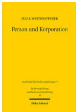
Person und Korporation Ladenpreis: 86,40EUR