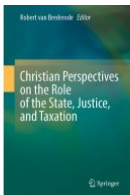
Christian Perspectives on the Role of the State, Justice, and Taxation Ladenpreis: 274,99EUR