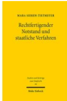
Rechtfertigender Notstand und staatliche Verfahren Ladenpreis: 86,40EUR