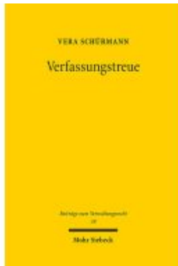
Verfassungstreue Ladenpreis: 81,30EUR