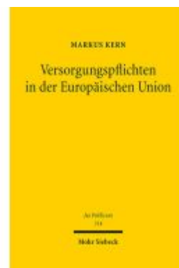
Versorgungspflichten in der Europäischen Union Ladenpreis: 178,90EUR