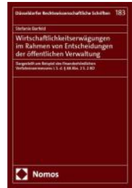
Wirtschaftlichkeitserwägungen im Rahmen von Entscheidungen der öffentlichen Verwaltung Ladenpreis: 76,10EUR