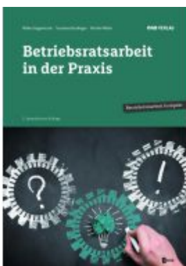
Betriebsratsarbeit in der Praxis Ladenpreis: 39,00EUR