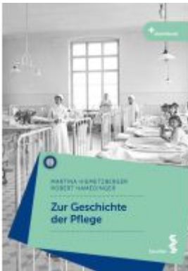
Zur Geschichte der Pflege Ladenpreis: 28,90EUR