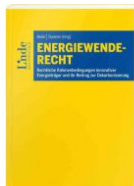
Energiewenderecht Ladenpreis: 89,00EUR