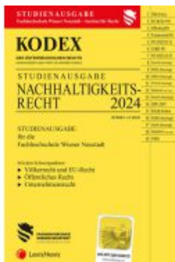
KODEX Nachhaltigkeitsrecht 2024 - inkl. App Ladenpreis: 23,00EUR