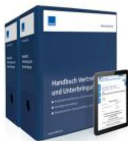
Handbuch Vertretung und Unterbringung Ladenpreis: 261,80EUR