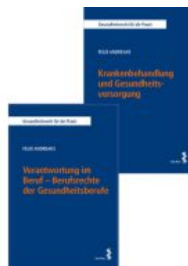
Kombipaket Verantwortung im Beruf – Berufsrechte der Gesundheitsberufe sowie Krankenbehandlung und Gesundheitsversorgung Ladenpreis: 59,00EUR