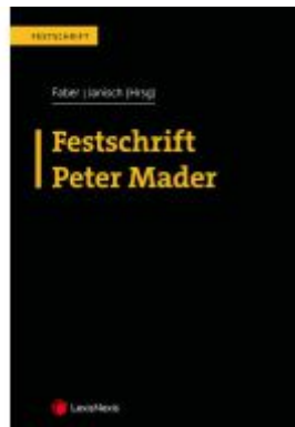
Festschrift Peter Mader Ladenpreis: 114,00EUR