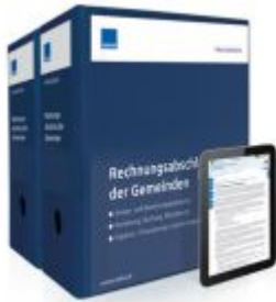
Rechnungsabschluss der Gemeinden Ladenpreis: 261,80EUR