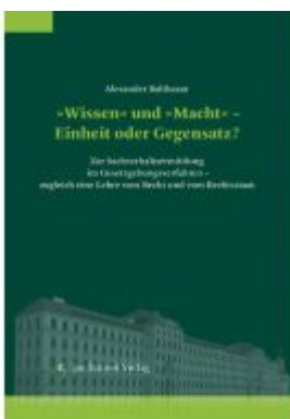
»Wissen« und »Macht« – Einheit oder Gegensatz? Ladenpreis: 198,00EUR