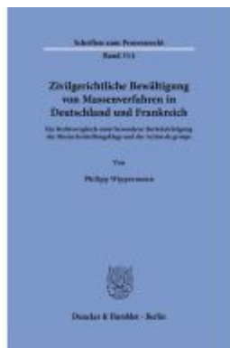
Zivilgerichtliche Bewältigung von Massenverfahren in Deutschland und Frankreich Ladenpreis: 92,50EUR