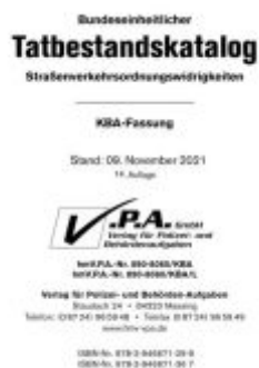
15. Ergänzung zum Bundeseinheitlichen Tatbestandskatalog, KBA-Langfassung, Stand 01 September 2023 Ladenpreis: 22,00EUR