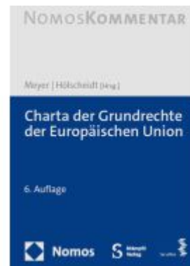
Charta der Grundrechte der Europäischen Union Ladenpreis: 163,50EUR