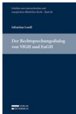
Der Rechtsprechungsdialog von VfGH und EuGH Ladenpreis: 84,00EUR