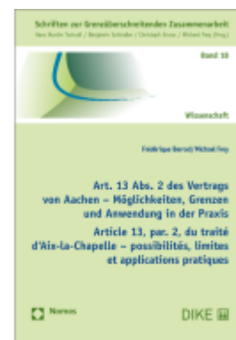
Art. 13 Abs. 2 des Vertrags von Aachen – Möglichkeiten, Grenzen und Anwendung in der Praxis Ladenpreis: 59,00EUR