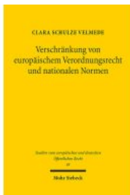
Verschränkung von europäischem Verordnungsrecht und nationalen Normen Ladenpreis: 91,50EUR