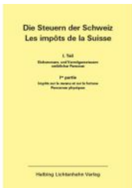
Die Steuern der Schweiz: Teil I EL 160 Ladenpreis: 185,00EUR