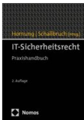
IT-Sicherheitsrecht Ladenpreis: 163,50EUR