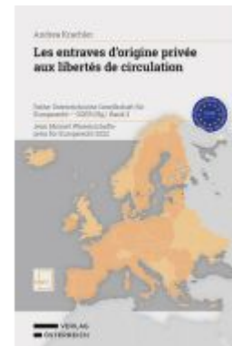
Les entraves d'origine privée aux libertés de circulation Ladenpreis: 88,00EUR