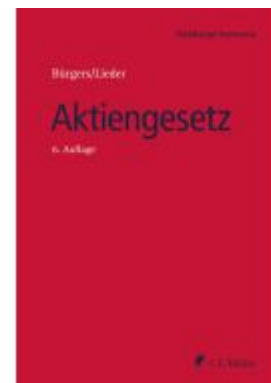
Aktiengesetz Ladenpreis: 286,90EUR