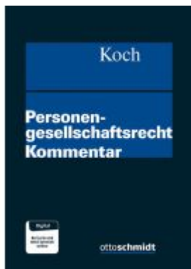
Personengesellschaftsrecht Ladenpreis: 204,60EUR