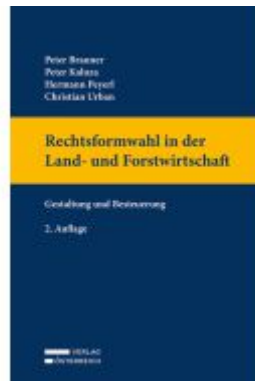
Rechtsformwahl in der Land- und Forstwirtschaft Ladenpreis: 93,00EUR