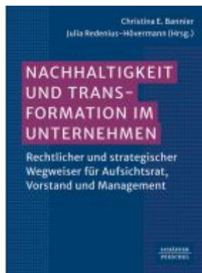
Nachhaltigkeit und Transformation im Unternehmen Ladenpreis: 82,30EUR