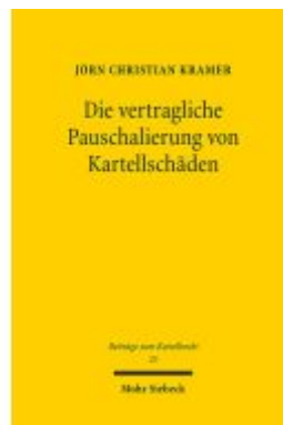
Die vertragliche Pauschalierung von Kartellschäden Ladenpreis: 91,50EUR