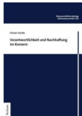
Verantwortlichkeit und Nachhaftung im Konzern Ladenpreis: 76,10EUR