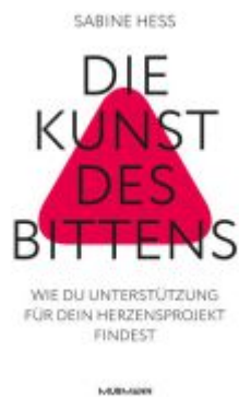
Die Kunst des Bittens Ladenpreis: 29,80EUR