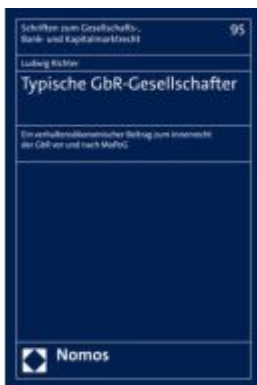
Typische GbR-Gesellschafter Ladenpreis: 142,90EUR