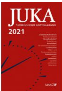
Österreichischer Juristenkalender 2021 JuKa Ladenpreis: 129,00 EUR