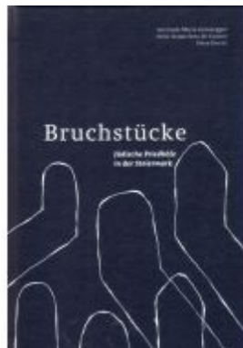
Bruchstücke Ladenpreis: 24,90 EUR