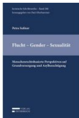
Flucht - Geschlecht - Sexualität Ladenpreis: 98,00 EUR