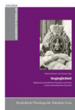
Vergänglichkeit Ladenpreis: 19,90 EUR