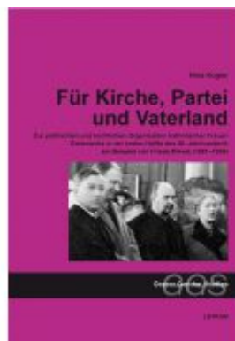
Für Kirche, Partei und "Vaterland" Ladenpreis: 19,90 EUR