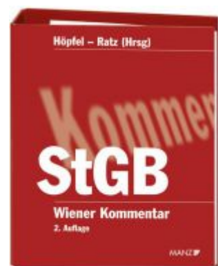
Wiener Kommentar zum Strafgesetzbuch 2. Auflage Ladenpreis: 648,00 EUR