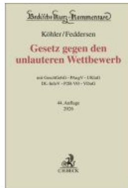
Gesetz gegen den unlauteren Wettbewerb Ladenpreis: 231,40EUR