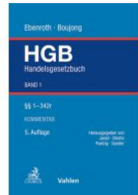
Handelsgesetzbuch Bd. 1: §§ 1-342r Ladenpreis: 400,00EUR