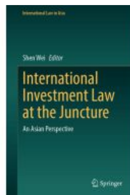
International Investment Law at the Juncture Ladenpreis: 219,99EUR