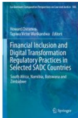
Financial Inclusion and Digital Transformation Regulatory Practices in Selected SADC Countries Ladenpreis: 186,99EUR

Wir haben andere Produkte gefunden, die Ihnen gefallen könnten!