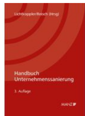
Handbuch Unternehmenssanierung Ladenpreis: 128,00EUR