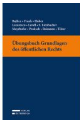
Übungsbuch Grundlagen des öffentlichen Rechts Ladenpreis: 19,00EUR