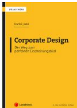
Corporate Design – Der Weg zum perfekten Erscheinungsbild Ladenpreis: 36,00EUR