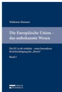
Die Europäische Union - das unbekannte Wesen Ladenpreis: 54,00EUR