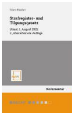
Strafregister- und Tilgungsgesetz Ladenpreis: 68,00EUR