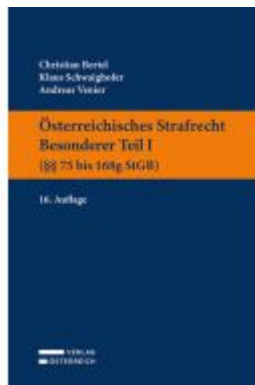
Österreichisches Strafrecht. Besonderer Teil I (§§ 75 bis 168g StGB) Ladenpreis: 39,00EUR