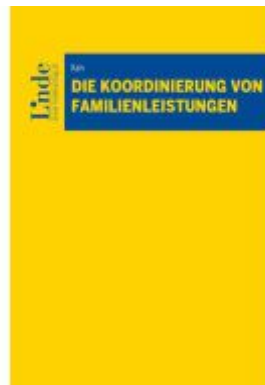
Die Koordinierung von Familienleistungen Ladenpreis: 48,00EUR