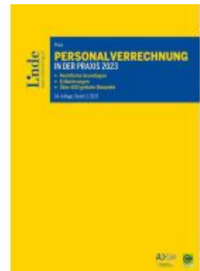
Personalverrechnung in der Praxis 2023 Ladenpreis: 116,00EUR