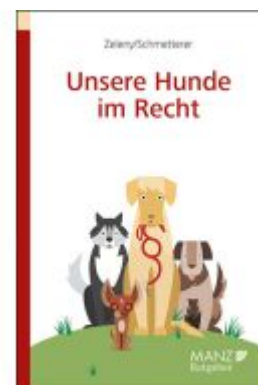
Unsere Hunde im Recht Ladenpreis: 23,80EUR