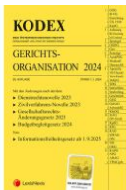
KODEX Gerichtsorganisation 2024 - inkl. App Ladenpreis: 82,00EUR