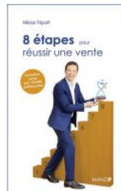
8 étapes pour réussir une vente Ladenpreis: 28,90 EUR