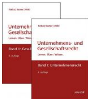
PAKET: Unternehmensrecht + Gesellschaftsrecht Ladenpreis: 97,00 EUR