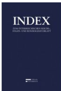
Index Ladenpreis: 389,00 EUR