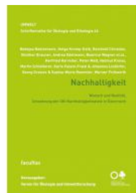
Nachhaltigkeit Ladenpreis: 16,90 EUR