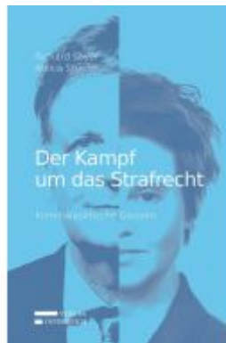
Der Kampf um das Strafrecht Ladenpreis: 25,00 EUR