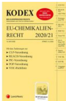
KODEX EU-Chemikalienrecht 2020/21 Ladenpreis: 95,00 EUR