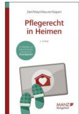
Pflegerrecht in Heimen Ladenpreis: 23,80 EUR