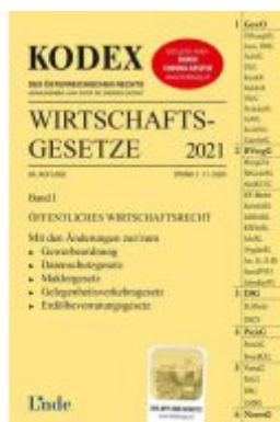
KODEX Wirtschaftssetze Band I 2021 Ladenpreis: 59,00 EUR