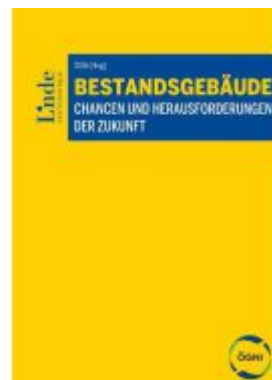
Bestandsgebäude Ladenpreis: 89,00EUR