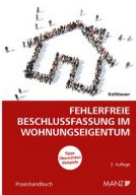
Fehlerfreie Beschlussfassung im Wohnungseigentum Ladenpreis: 32,00EUR