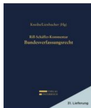
Rill-Schäffer-Kommentar Bundesverfassungsrecht Ladenpreis: 179,00EUR