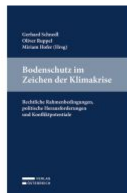
Bodenschutz im Zeichen der Klimakrise Ladenpreis: 59,00EUR