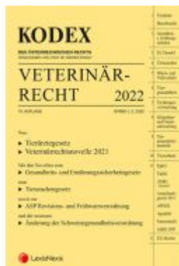
KODEX Veterinärrecht 2022 Ladenpreis: 96,00EUR

Wir haben andere Produkte gefunden, die Ihnen gefallen könnten!