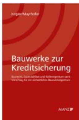
Bauwerke zur Kreditsicherung Ladenpreis: 54,00EUR