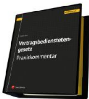
Vertragsbedienstetengesetz - Praxiskommentar Ladenpreis: 330,00EUR