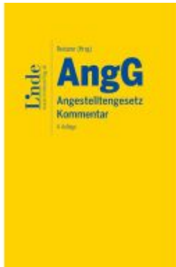
AngG | Angestelltengesetz Ladenpreis: 155,00EUR