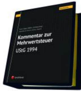
Kommentar zur Mehrwertsteuer - UStG 1994 Ladenpreis: 825,00EUR