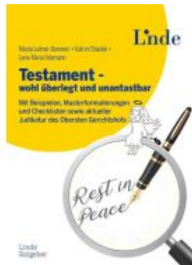
Testament - wohl überlegt und unantastbar Ladenpreis: 19,90EUR