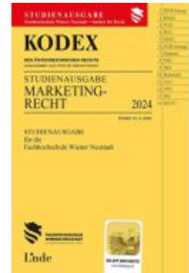
KODEX Studienausgabe Marketingrecht Ladenpreis: 24,00EUR