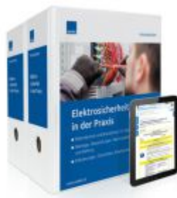
Elektrosicherheit in der Praxis Ladenpreis: 273,90EUR