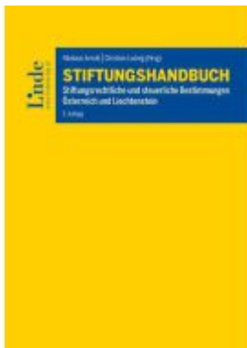
Stiftungshandbuch Ladenpreis: 110,00EUR

Wir haben andere Produkte gefunden, die Ihnen gefallen könnten!