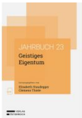
Geistiges Eigentum Ladenpreis: 78,00EUR