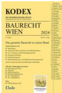
KODEX Baurecht Wien 2024 Ladenpreis: 59,00EUR