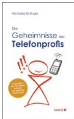
Die Geheimnisse des Telefonprofis Ladenpreis: 21,90 EUR