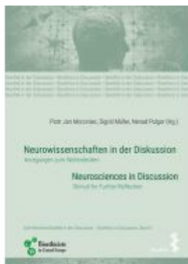
Neurowissenschaften in der Diskussion/Neurosciences in discussion Ladenpreis: 24,90 EUR