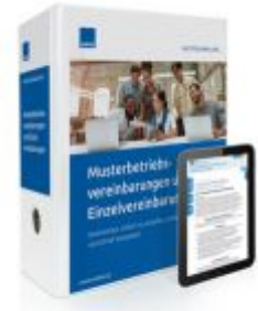
Musterbetriebsvereinbarungen und Einzelvereinbarungen Ladenpreis: 217,80 EUR