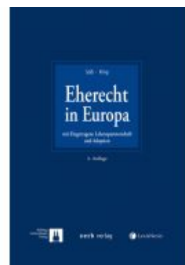
Eherecht in Europa Ladenpreis: 169,00 EUR