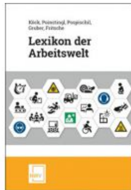
Lexikon der Arbeitswelt Ladenpreis: 69,00 EUR