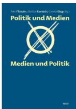
Politik und Medien - Medien und Politik Ladenpreis: 19,90 EUR