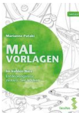
Im kühlen Nass Ladenpreis: 4,90 EUR