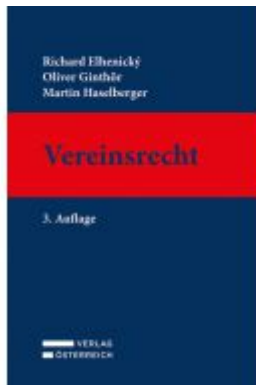
Vereinsrecht Ladenpreis: 98,00 EUR