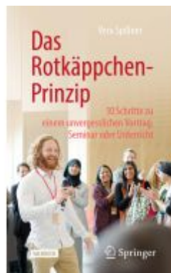
Das Rotkäppchen-Prinzip Ladenpreis: 28,78EUR