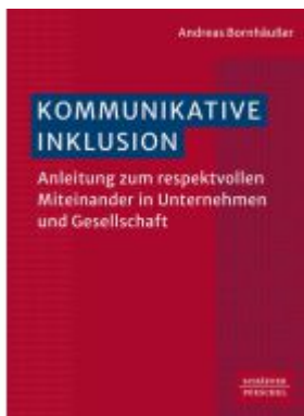
Kommunikative Inklusion Ladenpreis: 36,00EUR