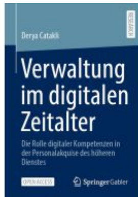
Verwaltung im digitalen Zeitalter Ladenpreis: 43,99EUR