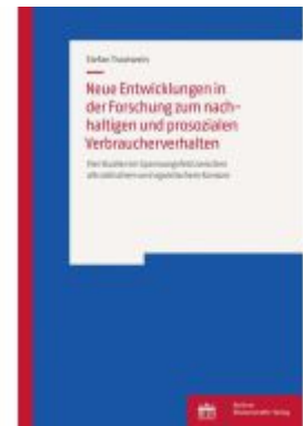
Neue Entwicklungen in der Forschung zum nachhaltigen und prosozialem Verbraucherverhalten Ladenpreis: 39,10EUR