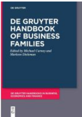
De Gruyter Handbook of Business Families Ladenpreis: 139,95EUR