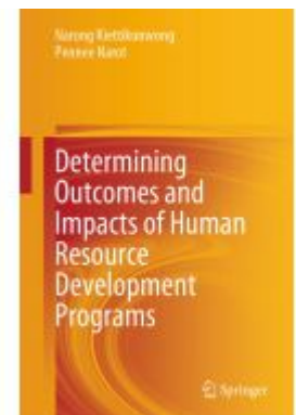
Determining Outcomes and Impacts of Human Resource Development Programs Ladenpreis: 131,99EUR