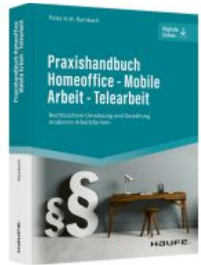
Praxishandbuch Homeoffice - Mobile Arbeit - Telearbeit Ladenpreis: 61,70EUR