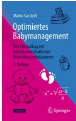
Optimiertes Babymanagement Ladenpreis: 30,83EUR