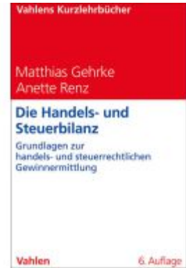
Die Handels- und Steuerbilanz Ladenpreis: 30,70EUR