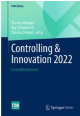
Controlling & Innovation 2022 Ladenpreis: 51,39EUR