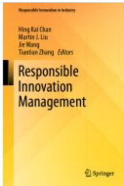
Responsible Innovation Management Ladenpreis: 109,99EUR