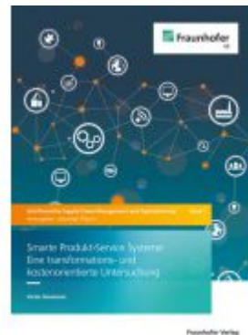
Smarte Produkt-Service-Systeme: Eine transformations- und kostenorientierte Untersuchung Ladenpreis: 71,00EUR