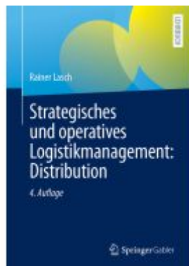
Strategisches und operatives Logistikmanagement: Distribution Ladenpreis: 39,06EUR