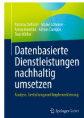
Datenbasierte Dienstleistungen nachhaltig umsetzen Ladenpreis: 51,39EUR