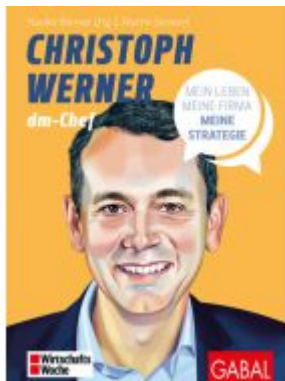
Christoph Werner Ladenpreis: 32,90EUR

Wir haben andere Produkte gefunden, die Ihnen gefallen könnten!