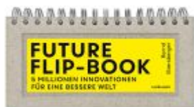
Future Flip-Book Ladenpreis: 29,80EUR