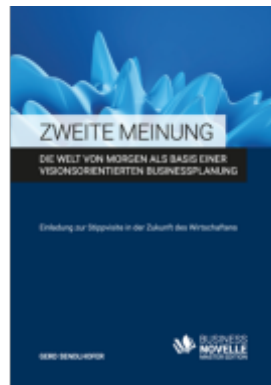
ZWEITE MEINUNG Ladenpreis: 29,70EUR