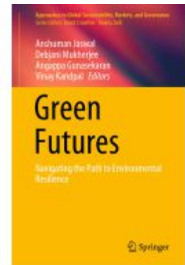
Green Futures Ladenpreis: 241,99EUR