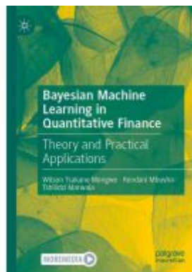
Bayesian Machine Learning in Quantitative Finance Ladenpreis: 153,99EUR