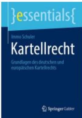
Kartellrecht Ladenpreis: 15,41EUR