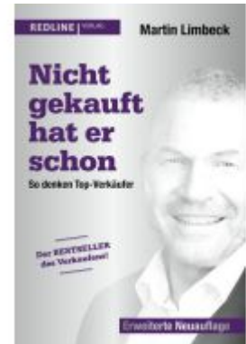
Nicht gekauft hat er schon Ladenpreis: 20,60EUR