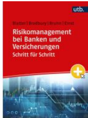
Risikomanagement bei Banken und Versicherungen Schritt für Schritt Ladenpreis: 29,80EUR