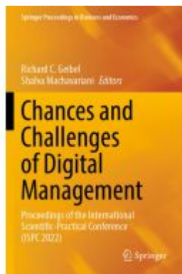
Chances and Challenges of Digital Management Ladenpreis: 164,99EUR