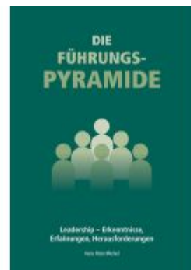
Die Führungspyramide Ladenpreis: 19,90EUR