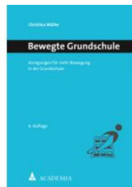
Bewegte Grundschule Ladenpreis: 35,00EUR