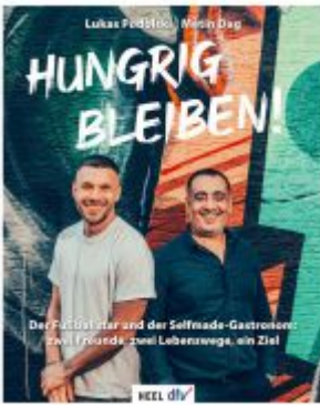
Hungrig bleiben Ladenpreis: 20,50EUR