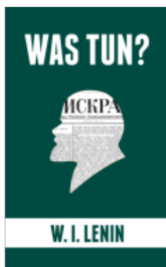
Was tun? Ladenpreis: 12,00EUR