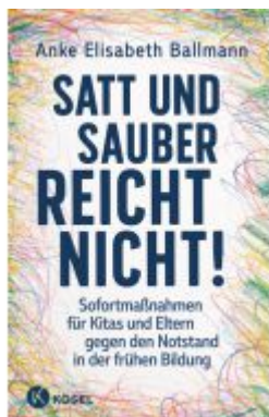
Satt und sauber reicht nicht! Ladenpreis: 22,70EUR

Wir haben andere Produkte gefunden, die Ihnen gefallen könnten!