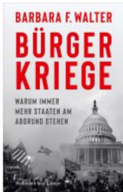
Bürgerkriege Ladenpreis: 26,80EUR