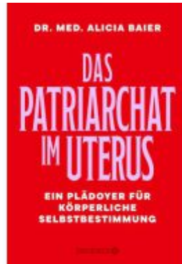
Das Patriarchat im Uterus Ladenpreis: 22,70EUR