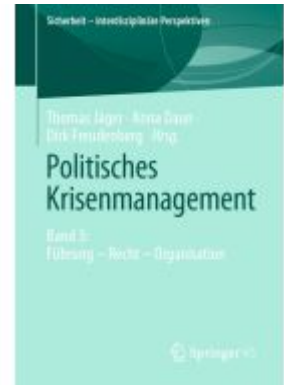
Politisches Krisenmanagement Ladenpreis: 61,68EUR