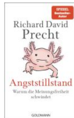
Angststillstand Ladenpreis: 20,60EUR