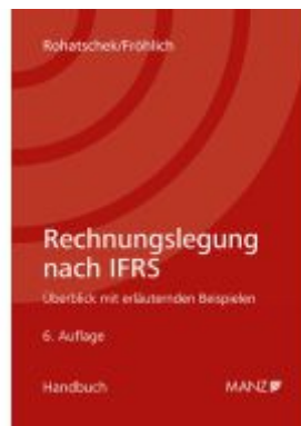
Rechnungslegung nach IFRS Ladenpreis: 74,00EUR