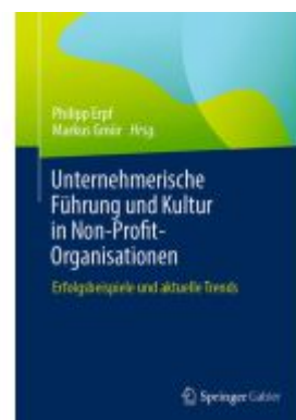
Unternehmerische Führung und Kultur in Non-Profit-Organisationen Ladenpreis: 51,39EUR