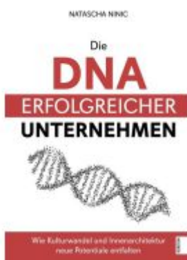
Die DNA erfolgreicher Unternehmen Ladenpreis: 30,80EUR