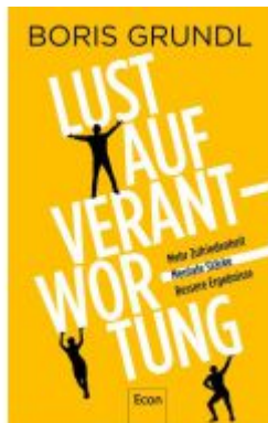
Lust auf Verantwortung Ladenpreis: 22,70EUR

Wir haben andere Produkte gefunden, die Ihnen gefallen könnten!