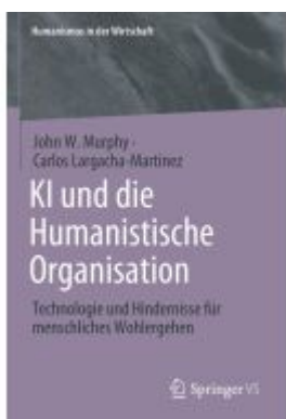
KI und die Humanistische Organisation Ladenpreis: 123,35EUR