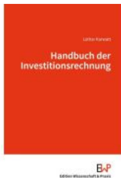
Handbuch der Investitionsrechnung Ladenpreis: 71,90EUR