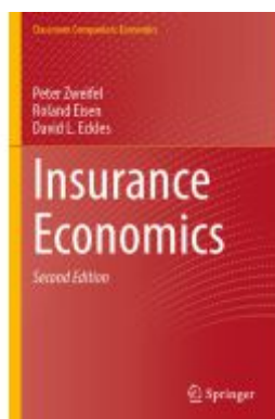
Insurance Economics Ladenpreis: 71,49EUR