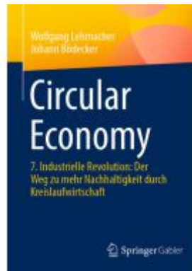
Circular Economy Ladenpreis: 41,11EUR