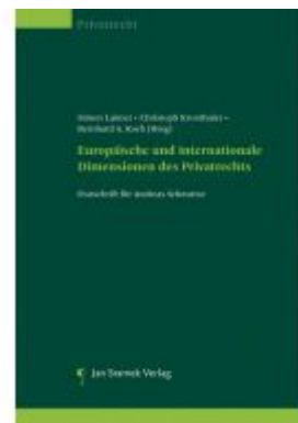
Europäische und internationale Dimensionen des Privatrechts Ladenpreis: 128,00 EUR