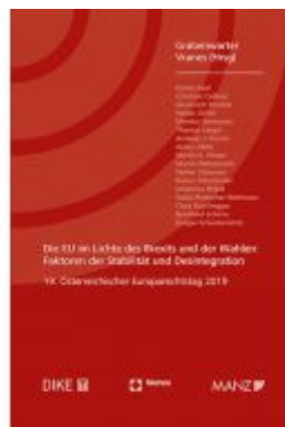
Die EU im Lichte des Brexits und der Wahlen Europarechtstag 2019 Ladenpreis: 58,00 EUR