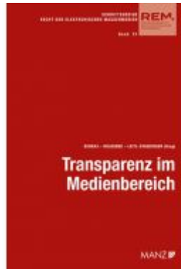
Transparenz im Medienbereich Aktuelle Fragen der Umsetzung Ladenpreis: 42,00 EUR