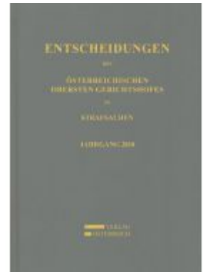
Entscheidungen des Österreichischen Obersten Gerichtshofes in Strafsachen Ladenpreis: 168,00 EUR