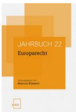
Europarecht Ladenpreis: 78,00 EUR