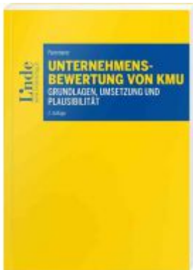
Unternehmensbewertung von KMU Ladenpreis: 59,00 EUR