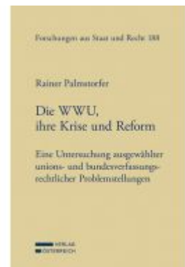
Die WWU, ihre Krise und Reform Ladenpreis: 149,00 EUR