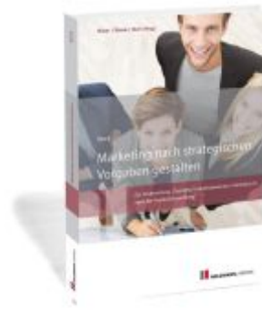
Marketing nach strategischen Vorgaben gestalten Ladenpreis: 35,90EUR