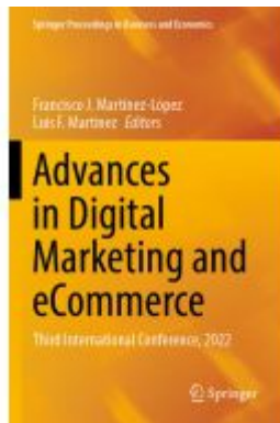
Advances in Digital Marketing and eCommerce Ladenpreis: 186,99EUR