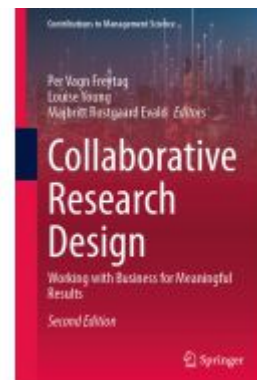
Collaborative Research Design Ladenpreis: 131,99EUR