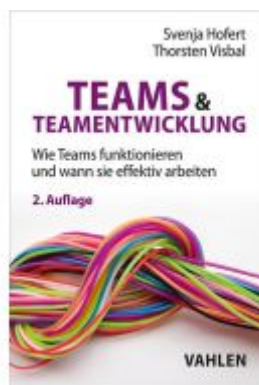
Teams & Teamentwicklung Ladenpreis: 33,90EUR