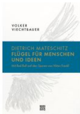
Dietrich Mateschitz: Flügel für Menschen und Ideen Ladenpreis: 26,00EUR