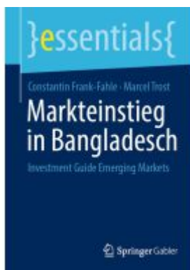
Markteinstieg in Bangladesch Ladenpreis: 15,41EUR