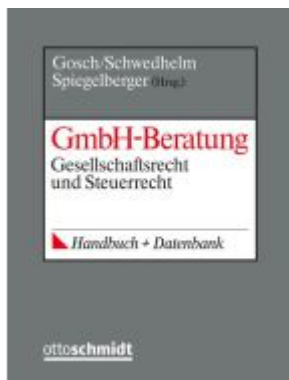
GmbH-Beratung Ladenpreis: 153,20EUR

Wir haben andere Produkte gefunden, die Ihnen gefallen könnten!