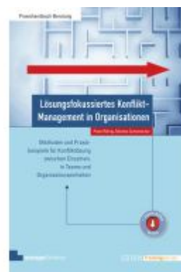
Lösungsfokussiertes Konflikt-Management in Organisationen Ladenpreis: 51,30EUR