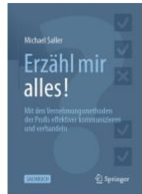
Erzähl mir alles! Ladenpreis: 30,83EUR