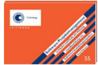
Software-Projektmanagement Ladenpreis: 257,10EUR