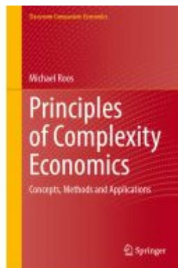
Principles of Complexity Economics Ladenpreis: 109,99EUR