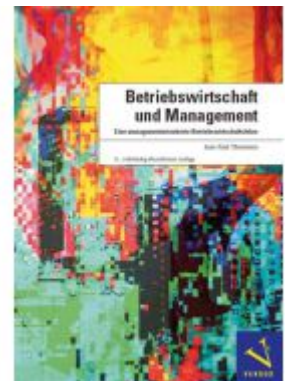
Betriebswirtschaft und Management Ladenpreis: 98,00EUR