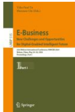
E-Business. New Challenges and Opportunities for Digital-Enabled Intelligent Future Ladenpreis: 175,99EUR