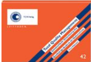
Total Quality Management Ladenpreis: 257,10EUR

Wir haben andere Produkte gefunden, die Ihnen gefallen könnten!