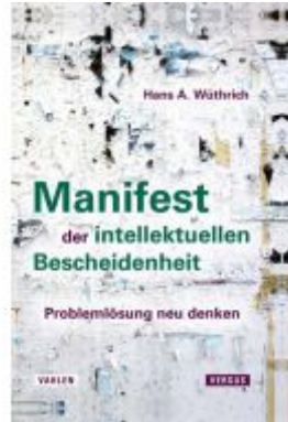
Manifest der intellektuellen Bescheidenheit Ladenpreis: 25,60EUR