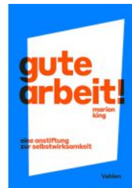
Gute Arbeit! Ladenpreis: 30,70EUR