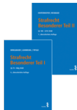
Kombipaket Strafrecht Besonderer Teil I und Besonderer Teil II Ladenpreis: 82,00EUR