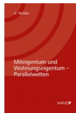
Miteigentum und Wohnungseigentum - Parallelwelten