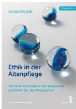
Ethik in der Altenpflege Ladenpreis: 22,90 EUR