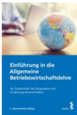
Einführung in die Allgemeine Betriebswirtschaftslehre Ladenpreis: 26,00EUR