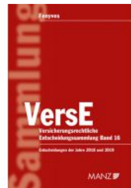
Versicherungrechtliche Entscheidungssammlung VersE Ladenpreis: 259,00 EUR