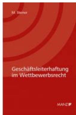
Geschäftsleiterhaftung im Wettbewerbsrecht Ladenpreis: 58,00 EUR