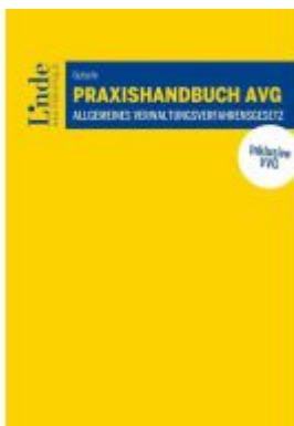
Praxishandbuch AVG | Allgemeines Verwaltungsverfahrensgesetz Ladenpreis: 49,00EUR