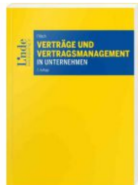
Verträge und Vertragsmanagement in Unternehmen Ladenpreis: 64,00 EUR