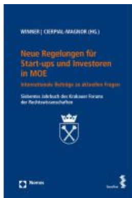
Neue Regelungen für Start-ups und Investoren in MOE Ladenpreis: 38,00EUR