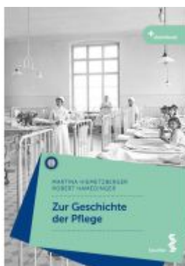
Zur Geschichte der Pflege Ladenpreis: 28,90EUR