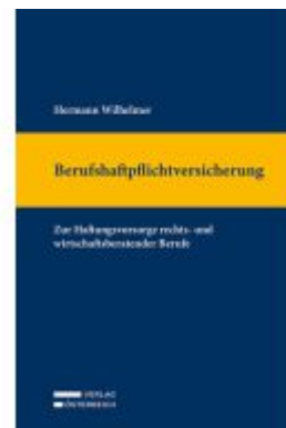
Berufshaftpflichtversicherung Ladenpreis: 269,00EUR