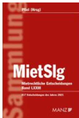
Mietrechtliche Entscheidungen MietSlg Ladenpreis: 238,00EUR

Wir haben andere Produkte gefunden, die Ihnen gefallen könnten!