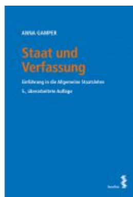
Staat und Verfassung