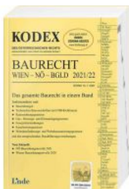
KODEX Baurecht Wien - NÖ - Bgld 2021/22