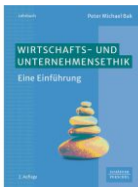
Wirtschafts- und Unternehmensethik Ladenpreis: 36,00EUR