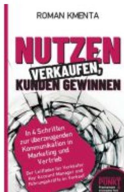
Nutzen verkaufen, Kunden gewinnen Ladenpreis: 24,97EUR