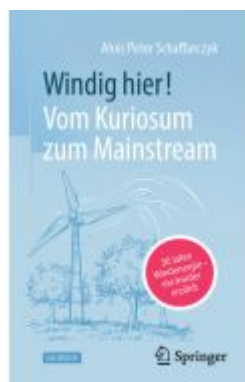
Windig hier! Vom Kuriosum zum Mainstream Ladenpreis: 25,69EUR