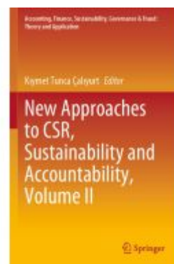
New Approaches to CSR, Sustainability and Accountability, Volume II Ladenpreis: 175,99EUR