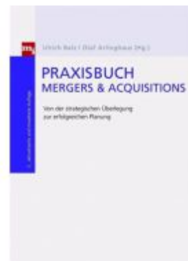
Praxisbuch Mergers & Acquisitions Ladenpreis: 82,20EUR