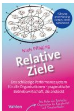
Relative Ziele Ladenpreis: 17,40EUR