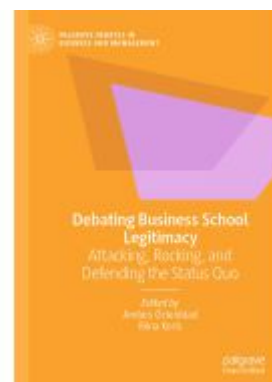
Debating Business School Legitimacy Ladenpreis: 186,99EUR