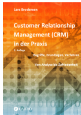
Customer Relationship Management (CRM) in der Praxis Ladenpreis: 29,90EUR