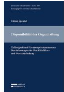
Disponibilität der Organhaftung Ladenpreis: 159,00EUR