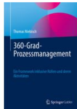
360-Grad-Prozessmanagement Ladenpreis: 56,53EUR