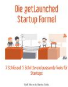
Die getLaunched Startup Formel Ladenpreis: 59,00EUR