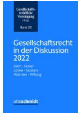
Gesellschaftsrecht in der Diskussion 2022 Ladenpreis: 56,40EUR