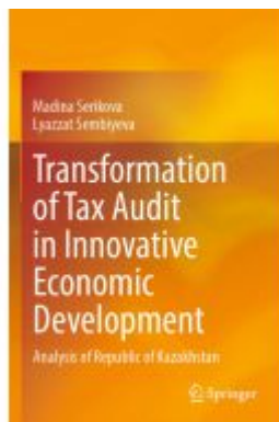
Transformation of Tax Audit in Innovative Economic Development Ladenpreis: 142,99EUR