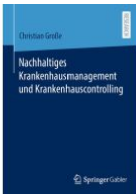
Nachhaltiges Krankenhausmanagement und Krankenhauscontrolling Ladenpreis: 71,95EUR