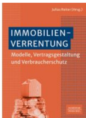
Immobilienverrentung Ladenpreis: 72,00EUR