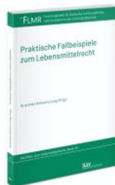
Praktische Fallbeispiele zum Lebensmittelrecht Ladenpreis: 19,60EUR