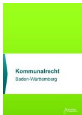
Kommunalrecht Baden-Württemberg Ladenpreis: 30,90EUR