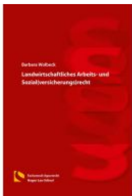
Landwirtschaftliches Arbeits- und Sozial(versicherungs)recht Ladenpreis: 19,50EUR