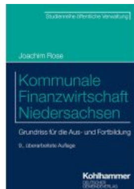
Kommunale Finanzwirtschaft Niedersachsen Ladenpreis: 43,20EUR