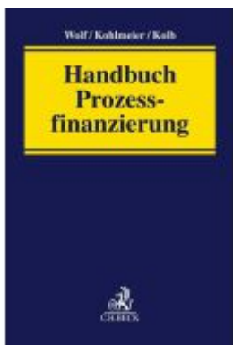
Handbuch Prozessfinanzierung Ladenpreis: 100,80EUR