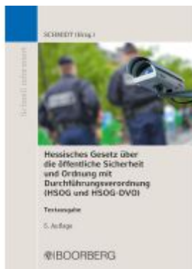
Hessisches Gesetz über die öffentliche Sicherheit und Ordnung und Verordnung zur Durchführung des Hessischen Gesetzes über die öffentliche Sicherheit und Ordnung und zur Durchführung des Hessischen Freiwilligen-Polizeidienst-Gesetzes (HSOG und HS... Ladenpreis: 15,30EUR