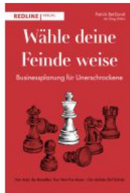
Wähle deine Feinde weise Ladenpreis: 22,70EUR