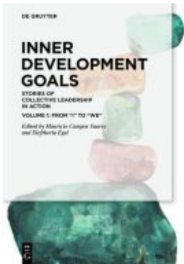
Inner Development Goals Ladenpreis: 34,95EUR