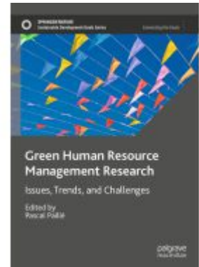
Green Human Resource Management Research Ladenpreis: 109,99EUR