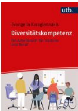
Diversitätskompetenz Ladenpreis: 27,70EUR