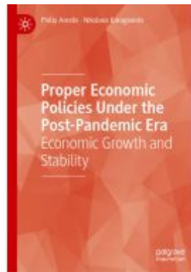
Proper Economic Policies Under the Post- Pandemic Era Ladenpreis: 131,99EUR