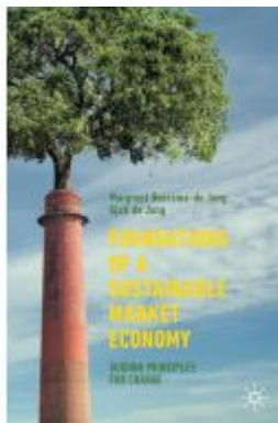
Foundations of a Sustainable Market Economy Ladenpreis: 60,49EUR