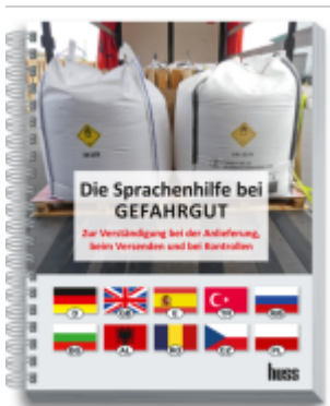
Die Sprachhilfe bei Gefahrgut Ladenpreis: 21,80EUR

Wir haben andere Produkte gefunden, die Ihnen gefallen könnten!