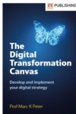
The Digital Transformation Canvas Ladenpreis: 34,23EUR