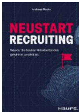
Neustart Recruiting Ladenpreis: 30,90EUR