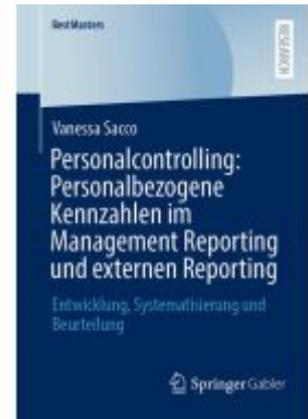
Personalcontrolling: Personalbezogene Kennzahlen im Management Reporting und externen Reporting Ladenpreis: 71,95EUR