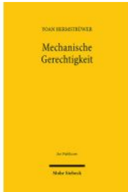
Mechanische Gerechtigkeit Ladenpreis: 122,40EUR