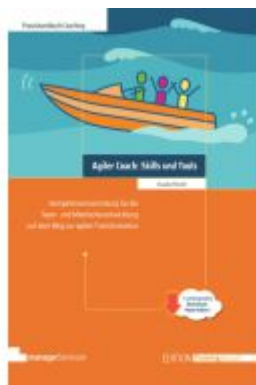
Agiler Coach: Skills und Tools Ladenpreis: 51,30EUR