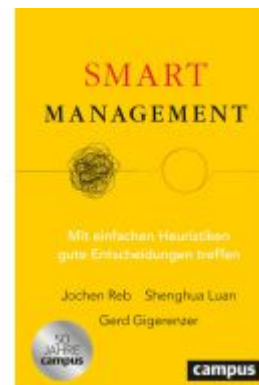
Smart Management Ladenpreis: 50,40EUR