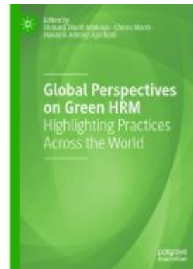
Global Perspectives on Green HRM Ladenpreis: 175,99EUR