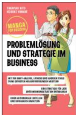
Manga for Success - Problemlösung und Strategie im Business Ladenpreis: 22,70EUR

Wir haben andere Produkte gefunden, die Ihnen gefallen könnten!