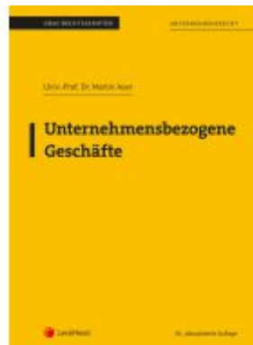
Unternehmensbezogene Geschäfte (Skriptum) Ladenpreis: 19,00 EUR