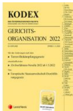
KODEX Gerichtsorganisation 2022 - inkl. App Ladenpreis: 76,00 EUR