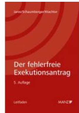
Der fehlerfreie Exekutionsantrag Ladenpreis: 56,00 EUR