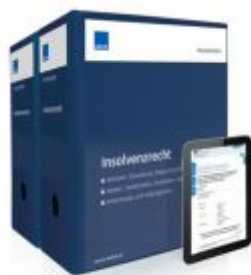
Insolvenzrecht Ladenpreis: 261,80 EUR