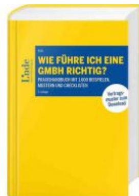
Wie führe ich eine GmbH richtig? Ladenpreis: 168,00 EUR