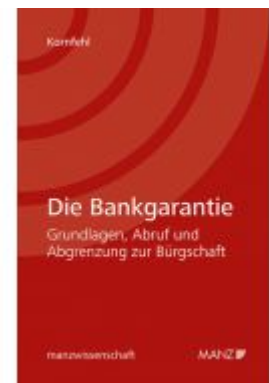
Die Bankgarantie Ladenpreis: 46,00 EUR