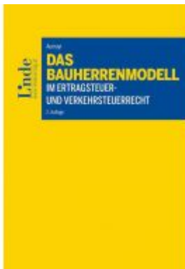
Das Bauherrenmodell im Ertragsteuer- und Verkehrssteuerrecht Ladenpreis: 59,00 EUR