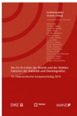
Die EU im Lichte des Brexits und der Wahlen Europarechtstag 2019 Ladenpreis: 58,00 EUR