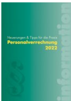
Personalverrechnung 2022 Ladenpreis: 42,00 EUR