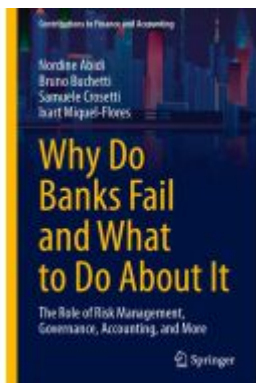
Why Do Banks Fail and What to Do About It Ladenpreis: 164,99EUR