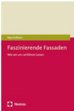
Faszinierende Fassaden Ladenpreis: 29,90EUR