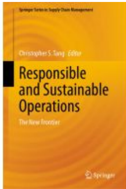
Responsible and Sustainable Operations Ladenpreis: 197,99EUR