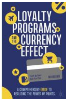
Loyalty Programs and the Currency Effect Ladenpreis: 49,49EUR