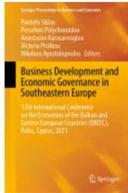
Business Development and Economic Governance in Southeastern Europe Ladenpreis: 219,99EUR