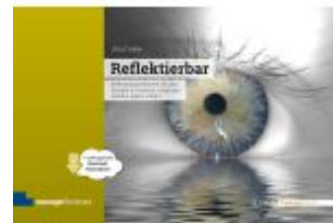
Reflektierbar Ladenpreis: 51,30EUR