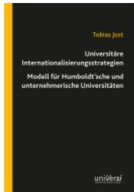
Universitäre Internationalisierungsstrategien – Modell für Humboldt'sche und unternehmerische Universitäten Ladenpreis: 19,00EUR