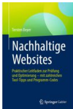
Nachhaltige Websites Ladenpreis: 41,11EUR