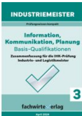
Industriemeister: Information, Kommunikation, Planung Ladenpreis: 12,40EUR