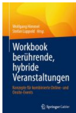
Workbook berührende, hybride Veranstaltungen Ladenpreis: 46,26EUR