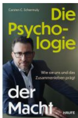
Die Psychologie der Macht Ladenpreis: 24,70EUR