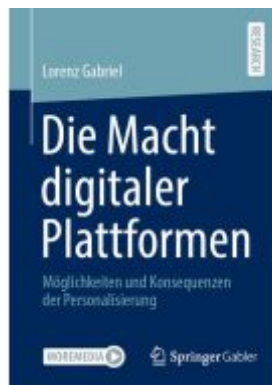
Die Macht digitaler Plattformen Ladenpreis: 71,95EUR