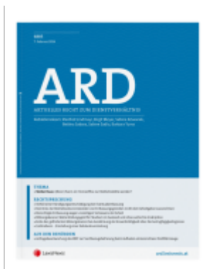
ARD Zeitschrift - Jahres-Abonnement (50 Hefte) Ladenpreis: 0,00EUR