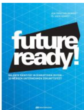
Future-ready! Ladenpreis: 36,90EUR