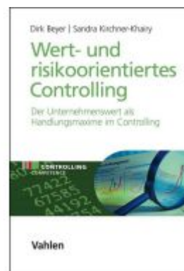
Wert- und risikoorientiertes Controlling Ladenpreis: 46,20EUR