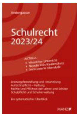
Schulrecht 2023/24 Ladenpreis: 44,00EUR