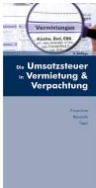
Die Umsatzsteuer in Vermietung und Verpachtung Ladenpreis: 15,00EUR

Wir haben andere Produkte gefunden, die Ihnen gefallen könnten!