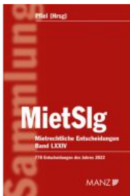
Mietrechtliche Entscheidungen MietSlg Ladenpreis: 249,00EUR