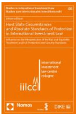
Host State Circumstances and Absolute Standards of Protection in International Investment Law Ladenpreis: 71,00EUR