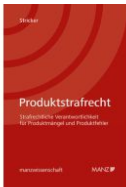
Produktstrafrecht Strafrechtliche Verantwortlichkeit für Produktmängel und Produktfehler Ladenpreis: 104,00EUR