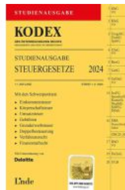
KODEX Studienausgabe Steuergesetze 2024 Ladenpreis: 17,00EUR