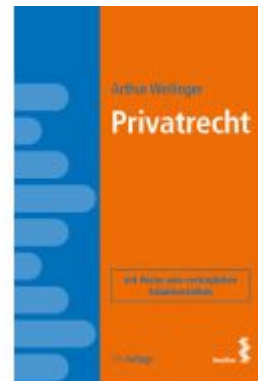
Privatrecht Ladenpreis: 48,00EUR