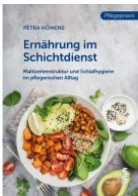
Ernährung im Schichtdienst Ladenpreis: 18,90EUR