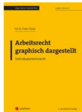
Arbeitsrecht graphisch dargestellt Ladenpreis: 26,25EUR