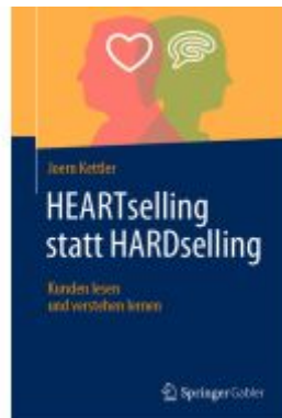
HEARTselling statt HARDselling Ladenpreis: 54,99EUR