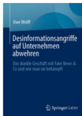
Desinformationsangriffe auf Unternehmen abwehren Ladenpreis: 61,67EUR