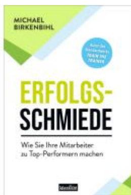
Erfolgsschmiede Ladenpreis: 19,60EUR