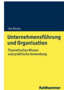
Nachhaltige Unternehmensführung und Personalmanagement Ladenpreis: 30,90EUR