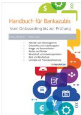
Handbuch für Bankazubis Ladenpreis: 27,40EUR