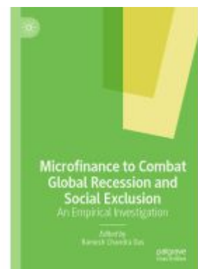
Microfinance to Combat Global Recession and Social Exclusion Ladenpreis: 175,99EUR