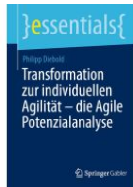
Transformation zur individuellen Agilität – die Agile Potenzialanalyse Ladenpreis: 15,41EUR