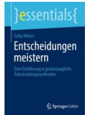
Entscheidungen meistern Ladenpreis: 13,46EUR