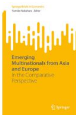
Emerging Multinationals from Asia and Europe Ladenpreis: 60,49EUR