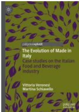
The Evolution of Made in Italy Ladenpreis: 54,99EUR

Wir haben andere Produkte gefunden, die Ihnen gefallen könnten!