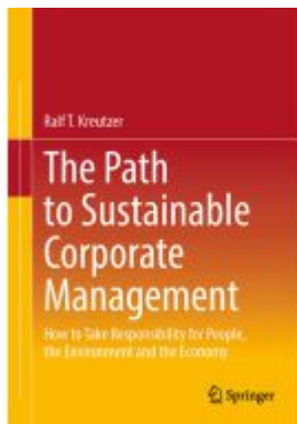
The Path to Sustainable Corporate Management Ladenpreis: 76,99EUR