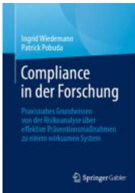
Compliance in der Forschung Ladenpreis: 46,25EUR