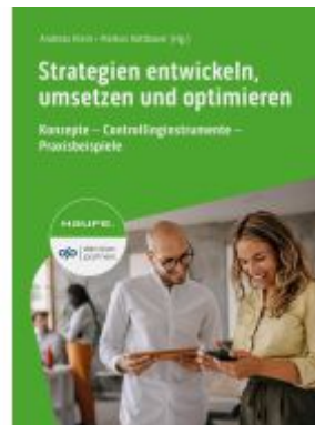
Strategien entwickeln, umsetzen und optimieren Ladenpreis: 92,60EUR