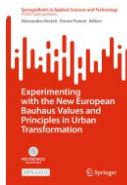
Experimenting with the New European Bauhaus Values and Principles in Urban Transformation Ladenpreis: 54,99EUR