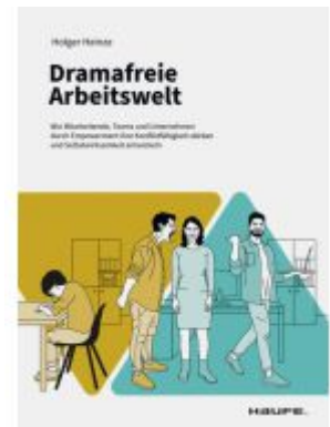
Dramafreie Arbeitswelt Ladenpreis: 30,90EUR