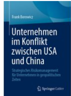
Unternehmen im Konflikt zwischen USA und China Ladenpreis: 46,25EUR