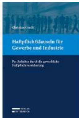
Haftpflichtklauseln für Gewerbe und Industrie Ladenpreis: 49,00EUR

Wir haben andere Produkte gefunden, die Ihnen gefallen könnten!