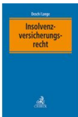
Insolvenzversicherungsrecht Ladenpreis: 308,50EUR