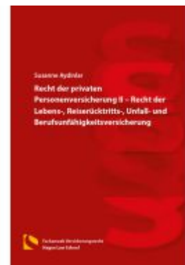
Recht der privaten Personenversicherung II – Recht der Lebens-, Reiserücktritts-, Unfall- und Berufsunfähigkeitsversicherung Ladenpreis: 25,70EUR