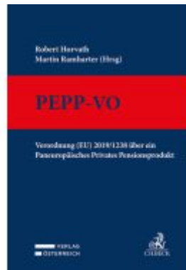
PEPP-VO Ladenpreis: 299,00EUR