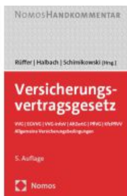
Versicherungsvertragsgesetz Ladenpreis: 184,10EUR