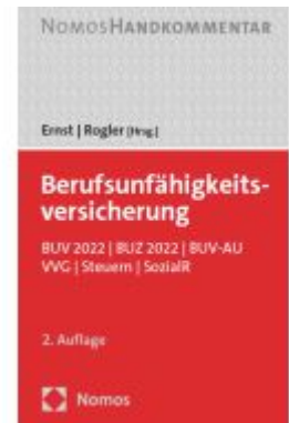
Berufsunfähigkeitsversicherung Ladenpreis: 184,10EUR