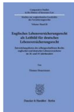
Englisches Lebensversicherungsrecht als Leitbild für deutsches Lebensversicherungsrecht. Ladenpreis: 113,00EUR