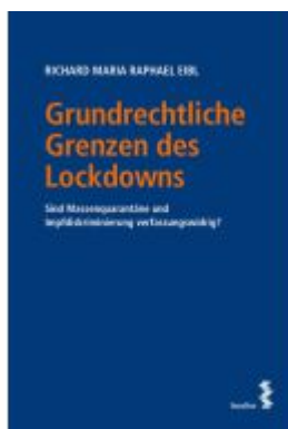
Grundrechtliche Grenzen des Lockdowns Ladenpreis: 28,00EUR