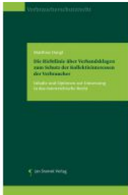
Die Richtlinie über Verbandsklagen zum Schutz der Kollektivinteressen der Verbraucher Ladenpreis: 85,00EUR