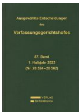
Ausgewählte Entscheidungen des Verfassungsgerichtshofes Ladenpreis: 459,00EUR