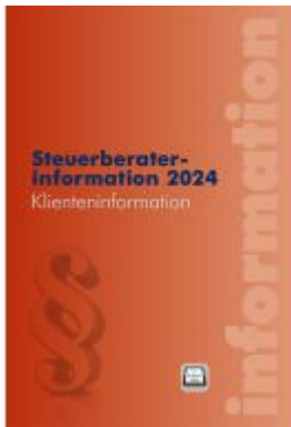
Steuerberaterinformation 2024 Ladenpreis: 52,00EUR