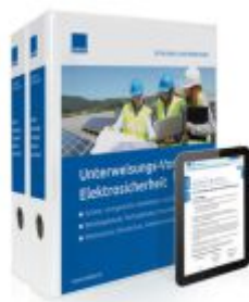
Unterweisungs-Vorlagen Elektrosicherheit Ladenpreis: 239,80EUR