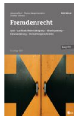
Fremdenrecht Ladenpreis: 39,00EUR