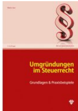
Umgründungen im Steuerrecht Ladenpreis: 59,40EUR