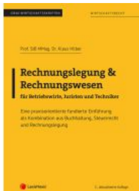
Rechnungslegung & Rechnungswesen für Betriebswirte, Juristen und Techniker Ladenpreis: 28,75EUR

Wir haben andere Produkte gefunden, die Ihnen gefallen könnten!