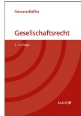
Gesellschaftsrecht Ladenpreis: 79,80EUR