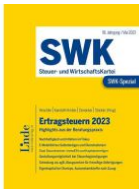
SWK-Spezial Ertragsteuern 2023 Ladenpreis: 41,00EUR