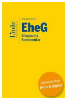
EheG | Ehegesetz (Kombi Print&digital) Ladenpreis: 198,00EUR