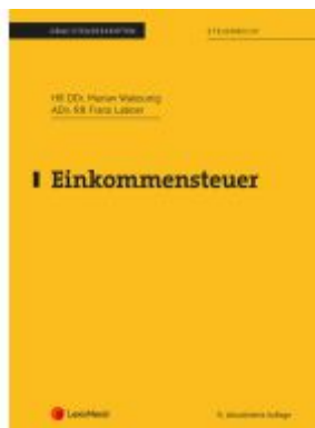
Einkommensteuer (Skriptum) Ladenpreis: 36,00EUR