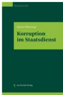
Korruption im Staatsdienst Ladenpreis: 85,00EUR