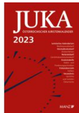
Österreichischer Juristenkalender 2023 JuKa Ladenpreis: 142,00EUR