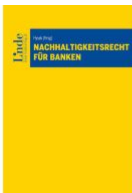
Nachhaltigkeitsrecht für Banken Ladenpreis: 88,00EUR