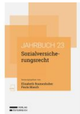
Sozialversicherungsrecht Ladenpreis: 68,00EUR