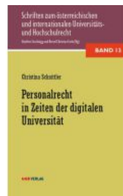
Personalrecht in Zeiten der digitalen Universität Ladenpreis: 36,00EUR