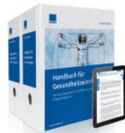
Handbuch für Gesundheitseinrichtungen Ladenpreis: 217,80 EUR