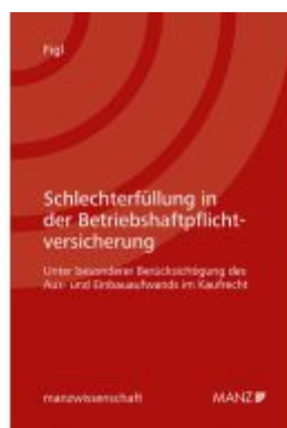
Schlechterfüllung in der Betriebshaftpflichtversicherung Ladenpreis: 44,00 EUR