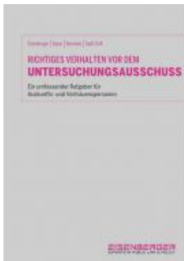
Richtiges Verhalten vor dem Untersuchungsausschuss Ladenpreis: 79,00 EUR

Wir haben andere Produkte gefunden, die Ihnen gefallen könnten!