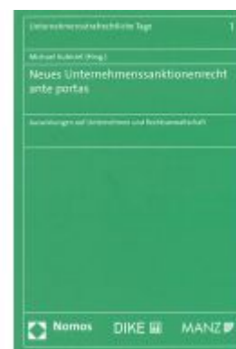
Neues Unternehmensanktionenrecht ante portas Ladenpreis: 49,00 EUR