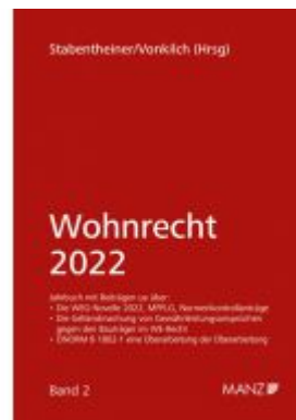
Wohnrecht 2022 Ladenpreis: 46,00 EUR