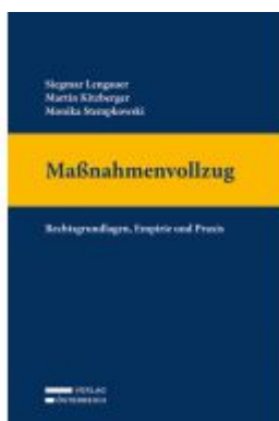
Maßnahmenvollzug Ladenpreis: 119,00 EUR