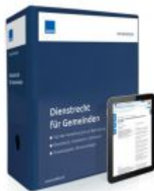
Dienstrecht für Gemeinden Ladenpreis: 250,80 EUR