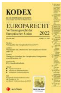
KODEX EU-Verfassungsrecht (Europarecht) 2022 - inkl. App Ladenpreis: 37,50 EUR