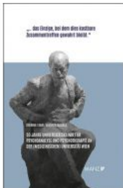
50 Jahre Universitätsklinik für Psychoanalyse und Psychotherapie an der (Medizinischen) Universität Wien Ladenpreis: 38,00 EUR