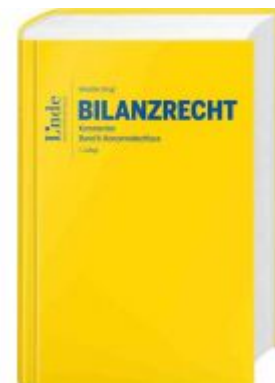
Bilanzrecht Ladenpreis: 118,00 EUR