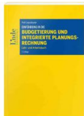
Einführung in die Budgetierung und integrierte Planungsrechnung Ladenpreis: 36,00 EUR