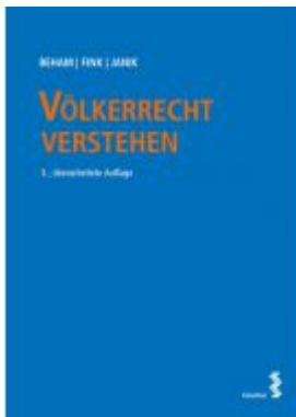
Völkerrecht verstehen Ladenpreis: 46,00 EUR

Wir haben andere Produkte gefunden, die Ihnen gefallen könnten!