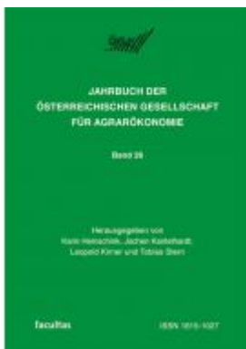
Jahrbuch der Österreichischen Gesellschaft für Agrarökonomie Ladenpreis: 25,70 EUR