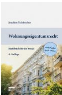
Wohnungseigentumsrecht Ladenpreis: 69,00 EUR