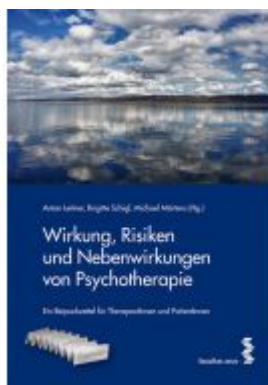
Wirkung, Risiken und Nebenwirkungen von Psychotherapie Ladenpreis: 24,90 EUR