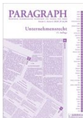
Paragraph - Unternehmensrecht Ladenpreis: 16,90 EUR