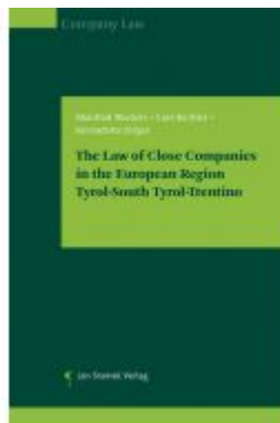
The Law of Close Companies in the European Region Tyrol-South Tyrol- Trentino Ladenpreis: 39,90 EUR