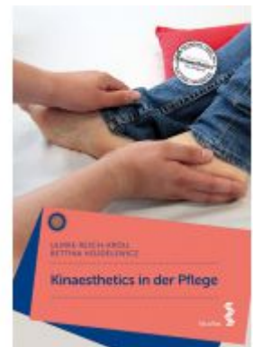
Kinaesthetics in der Pflege Ladenpreis: 29,90 EUR