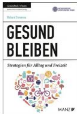
Gesund bleiben Ladenpreis: 23,90 EUR