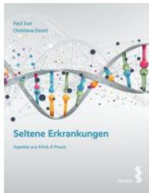
Seltene Erkrankungen Ladenpreis: 29,90 EUR