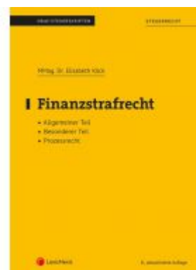
Finanzstrafrecht Ladenpreis: 23,00 EUR