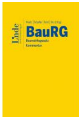
BauRG | Baurechtsgesetz Ladenpreis: 58,00 EUR

Wir haben andere Produkte gefunden, die Ihnen gefallen könnten!