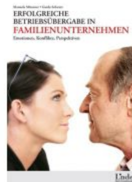
Erfolgreiche Betriebsübergabe in Familienunternehmen Ladenpreis: 24,90 EUR