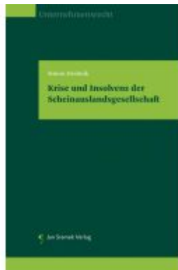
Krise und Insolvenz der Scheinauslandsgesellschaft Ladenpreis: 128,00EUR