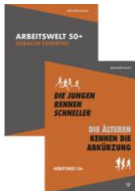
Arbeitswelt 50+: Band 1 und 2 im Set Ladenpreis: 49,50EUR