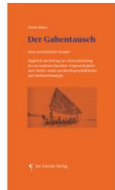
Der Gabentausch Ladenpreis: 24,90EUR