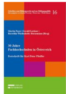
30 Jahre Fachhochschulen in Österreich Ladenpreis: 95,00EUR