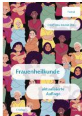
Frauenheilkunde Ladenpreis: 24,90EUR