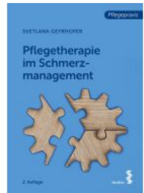
Pflegetherapie im Schmerzmanagement Ladenpreis: 26,90EUR