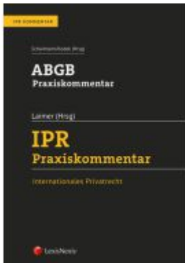
ABGB Praxiskommentar / IPR Praxiskommentar Ladenpreis: 360,00EUR