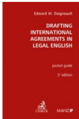
Drafting International Agreements in Legal English Ladenpreis: 36,00EUR