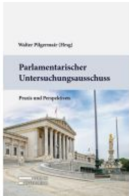
Parlamentarischer Untersuchungsausschuss Ladenpreis: 89,00EUR