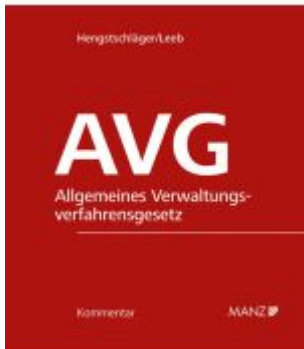
AVG-Kommentar 2.Ausgabe Ladenpreis: 248,00EUR