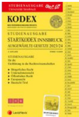
KODEX Startkodex Innsbruck 2023/24 - inkl. App Ladenpreis: 19,00EUR

Wir haben andere Produkte gefunden, die Ihnen gefallen könnten!