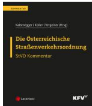
Die Österreichische Straßenverkehrsordnung Ladenpreis: 362,00EUR