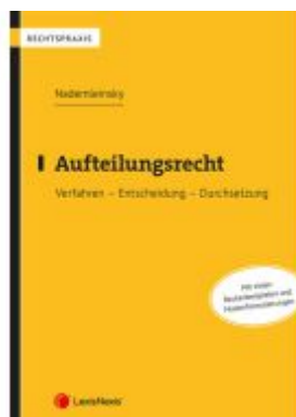
Aufteilungsrecht Ladenpreis: 39,00EUR