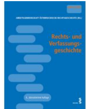
Rechts- und Verfassungsgeschichte Ladenpreis: 44,00EUR