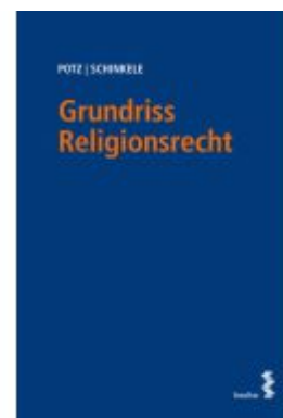
Grundriss Religionsrecht Ladenpreis: 78,00EUR