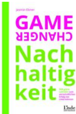
Game Changer Nachhaltigkeit Ladenpreis: 29,90EUR