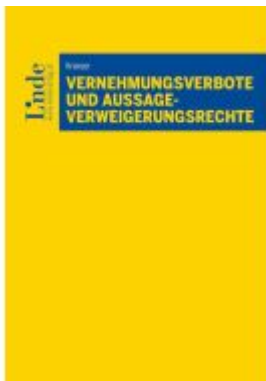
Vernehmungsverbote und Aussageverweigerungsrechte Ladenpreis: 29,00EUR

Wir haben andere Produkte gefunden, die Ihnen gefallen könnten!