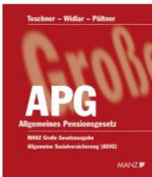
Allgemeines Pensionsgesetz Ladenpreis: 34,00EUR