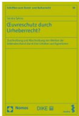
Euvreschutz durch Urheberrecht? Ladenpreis: 67,90EUR