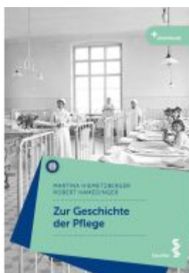
Zur Geschichte der Pflege Ladenpreis: 28,90EUR