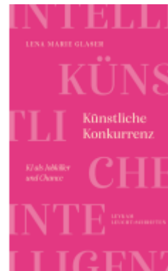
Künstliche Konkurrenz – KI als Jobkiller und Chance Ladenpreis: 14,50EUR