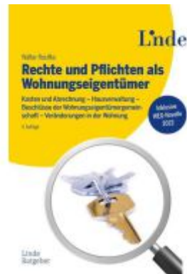
Rechte und Pflichten als Wohnungseigentümer Ladenpreis: 48,00EUR