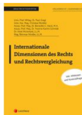
Internationale Dimensionen des Rechts und Rechtsvergleichung Ladenpreis: 21,50EUR