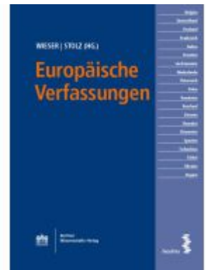
Europäische Verfassungen Ladenpreis: 29,00EUR