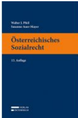
Österreichisches Sozialrecht Ladenpreis: 32,00 EUR