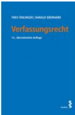
Verfassungsrecht Ladenpreis: 46,00 EUR