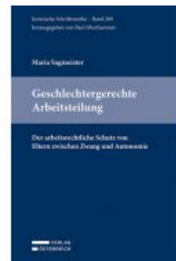
Geschlechtergerechte Arbeitsteilung Ladenpreis: 69,00 EUR