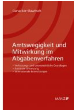
Amtswegigkeit und Mitwirkung im Abgabenverfahren Ladenpreis: 168,00 EUR