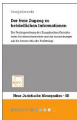
Der freie Zugang zu behördlichen Informationen Ladenpreis: 68,00 EUR