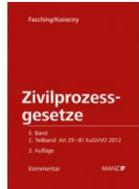
Kommentar zu den Zivilprozessgesetzen Art 29-81 EuGVVO 2012 ZPO Ladenpreis: 142,00 EUR