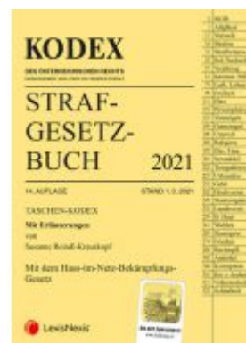
Taschen-Kodex Strafgesetzbuch 2021 Ladenpreis: 15,00 EUR