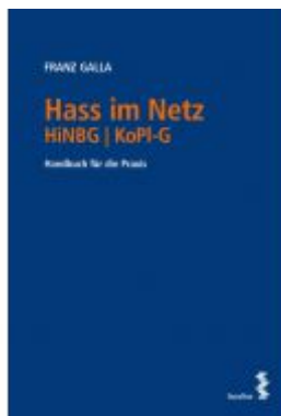
Hass im Netz HINBG | KoPI-G Ladenpreis: 39,00 EUR