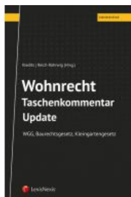
Wohnrecht Taschenkommentar - Update Ladenpreis: 49,00 EUR