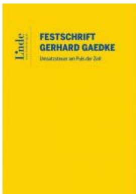
Umsatzsteuer am Puls der Zeit Ladenpreis: 44,00 EUR