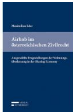
Airbnb im österreichischen Zivilrecht Ladenpreis: 53,00 EUR