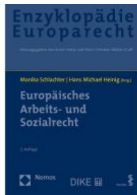
Europäisches Arbeits- und Sozialrecht Ladenpreis: 193,30 EUR