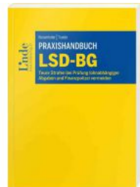
Praxishandbuch LSD-BG Ladenpreis: 42,00 EUR