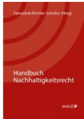
Handbuch Nachhaltigkeitsrecht Ladenpreis: 78,00 EUR