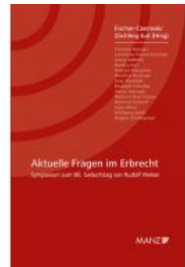
Aktuelle Fragen im Erbrecht Symposium zum 80. Geburtstag von Rudolf Welsch Ladenpreis: 34,80 EUR