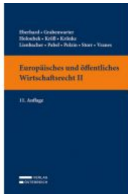
Europäisches und öffentliches Wirtschaftsrecht II Ladenpreis: 39,00 EUR