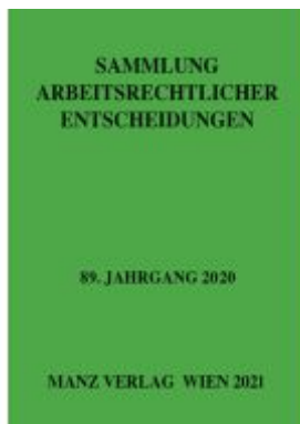
Sammlung arbeitsrechtlicher Entscheidungen Ladenpreis: 264,50EUR