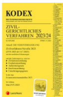
KODEX Zivilgerichtliches Verfahren 2023/24 - inkl. App Ladenpreis: 43,00EUR