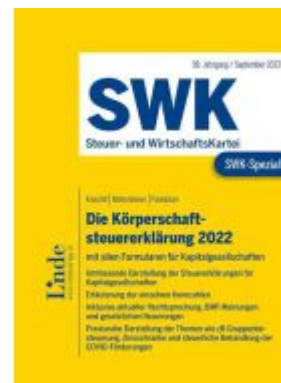
SWK-Spezial Die Körperschaftsteuererklärung 2022 Ladenpreis: 49,00EUR