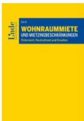
Wohnraummiete und Mietzinsbeschränkungen Ladenpreis: 54,00EUR