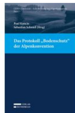
Das Protokoll „Bodenschutz“ der Alpenkonvention Ladenpreis: 45,00EUR