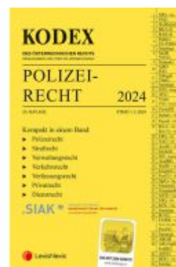
KODEX Polizeirecht 2024 - inkl. App Ladenpreis: 60,00EUR