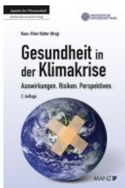
Gesundheit in der Klimakrise Ladenpreis: 23,90EUR