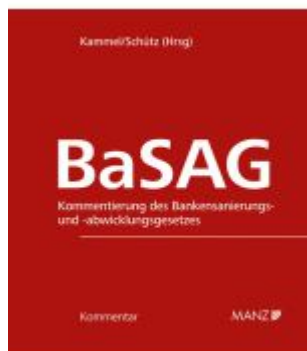
BaSAG - Bankensanierungs- und - abwicklungsgesetz Ladenpreis: 298,00EUR